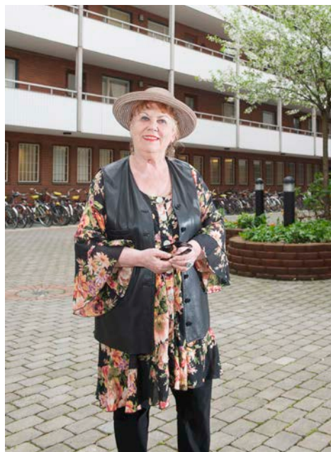
4 HEBA Bladet